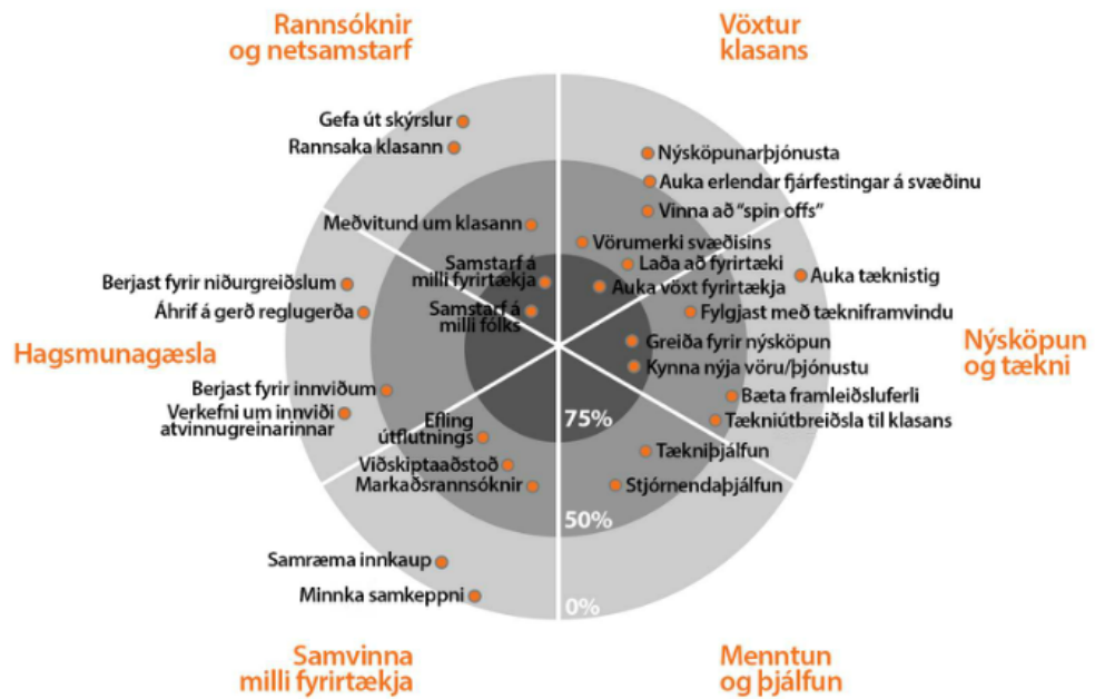
Mynd 2: Algeng verkefni klasa

Tengslamyndun gengur út á það að leita eftir og koma á samstarfi við aðra heilbrigðistækniklasa, sérstaklega á Norðurlöndum. Samstarf mun auka erlenda fagþekkingu hjá fyrirtækjum í heilbrigðistækni og þannig styrkja þau á alþjóðamarkaði. Einnig felst þessi vinna í að leita eftir og koma á samstarfi við klasa annarra atvinnugreina til að auka þekkingu á heilbrigðistækni í öðrum atvinnugreinum og auka þannig sóknarfæri. Helmingur þess hluta sem snýr að atburðum verður unnin á fyrsta ársfjórðungi og verður greiddur af SSH.