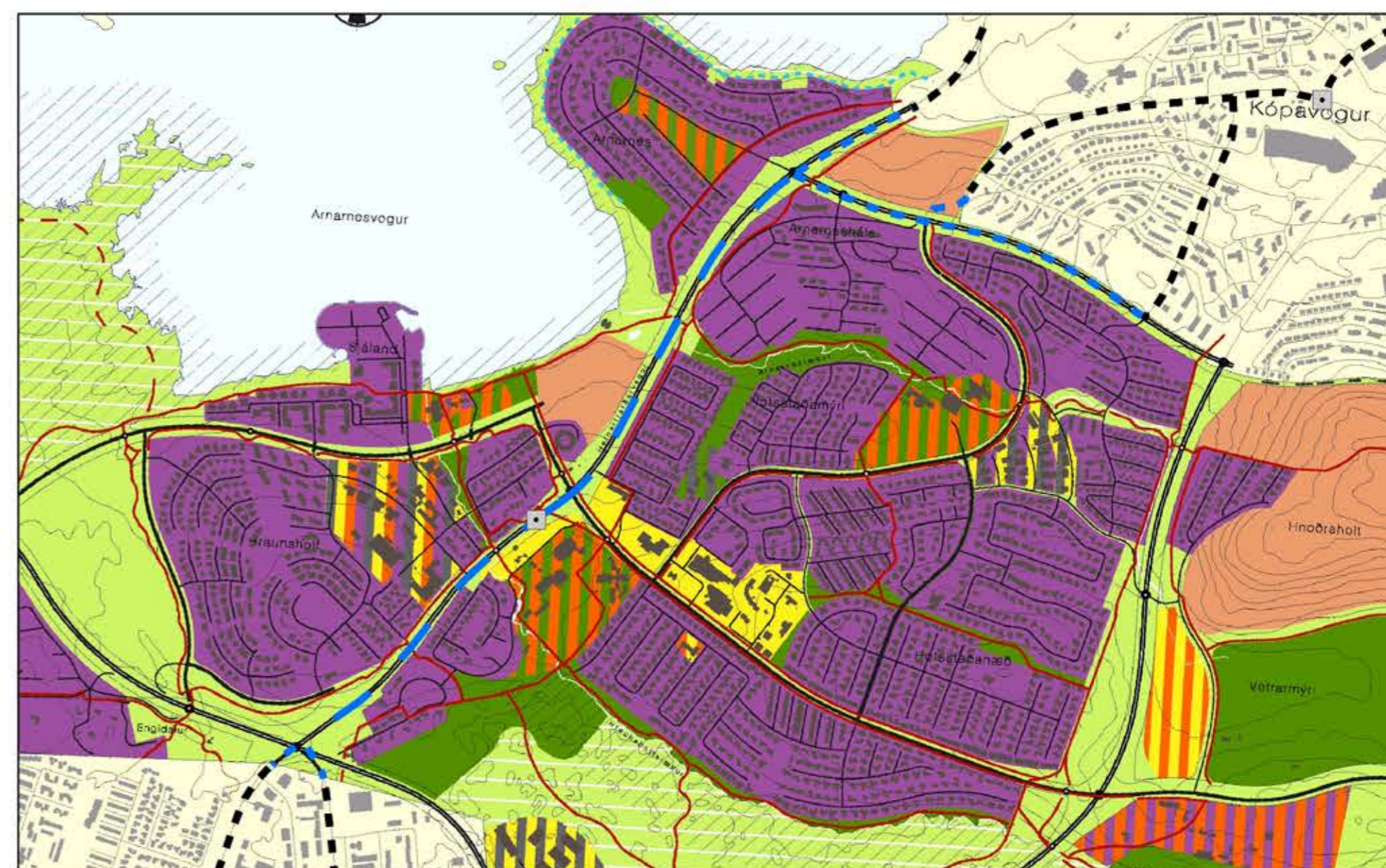
Tillaga að breytingu. Kvarði: 1:16.000 [A2] 0 0,5 1 2 km