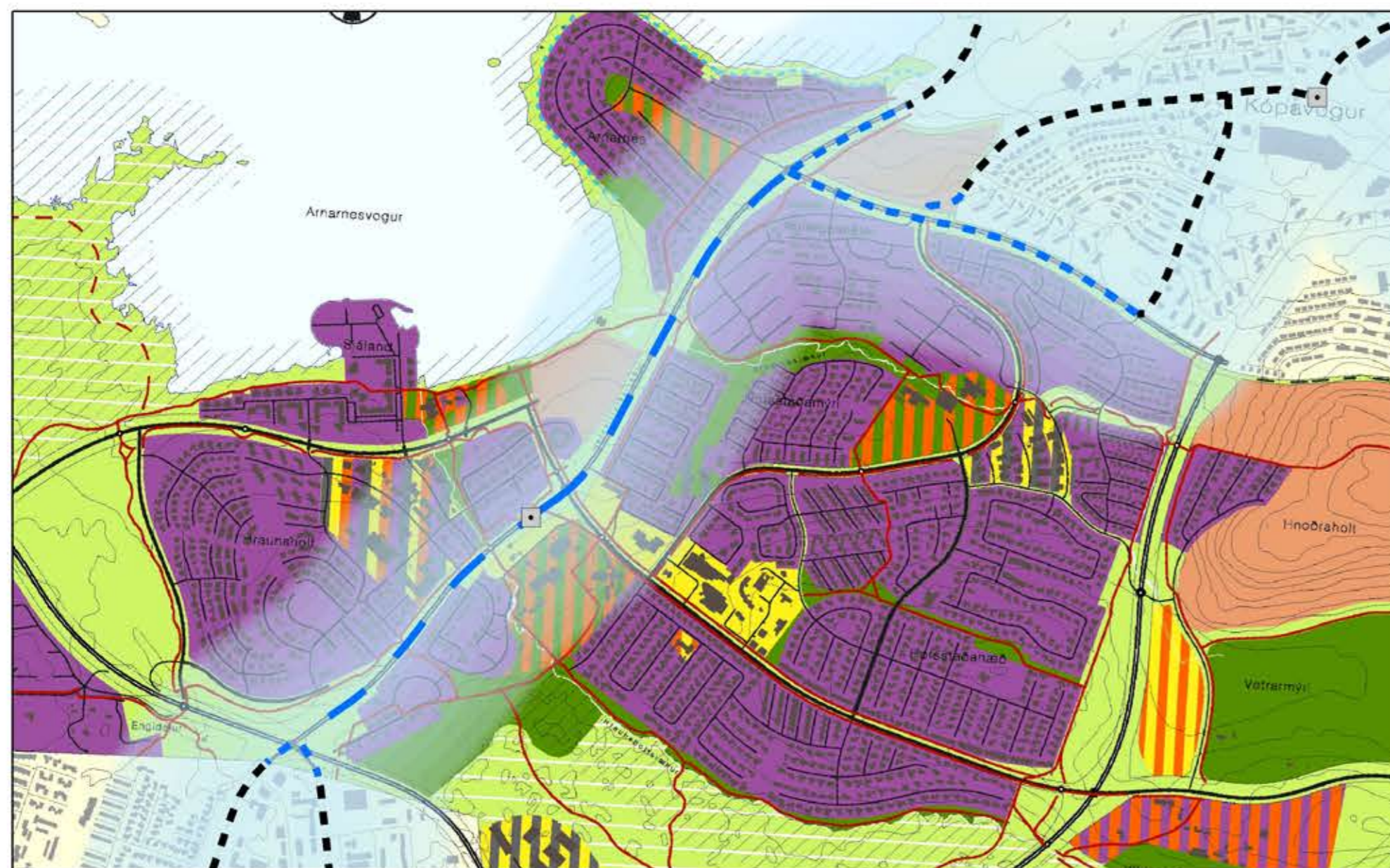
Þemakort. Líklegt áhrifasvæði Borgarlínu. Kvarði: 1:16.000 [A2]