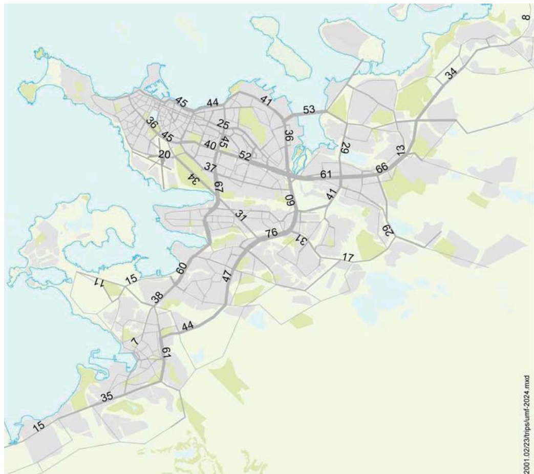
Mynd 4.1 Umferð árið 2024 miðað við 228 þúsund íbúa á höfuðborgarsvæðinu. Tölurnar sýna þúsundir bíla á dag (hversdagsumferð, hvdu).

Eftirfylgni: Í heild er mikilvægt að gera reglulega umferðarpár sem byggja m.a. á uppfærðum tölum um ferðavenjur höfuðborgarbúa og þróun byggðar. Með því móti er hægt að meta hver þessi áhrif kunna að verða og umfang þeirra og hvernig mögulegt er að bregðast við.